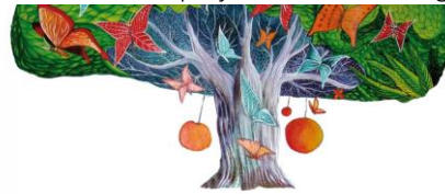
CUBAN CULTURAL VENTURES

Voor het tot stand brengen van een culturele en/of wetenschappelijke uitwisseling van en naar Cuba heeft Stichting 4711 Foundation een gift verstrekt voor een aantal projecten van Stichting Cuban Cultural Ventures.